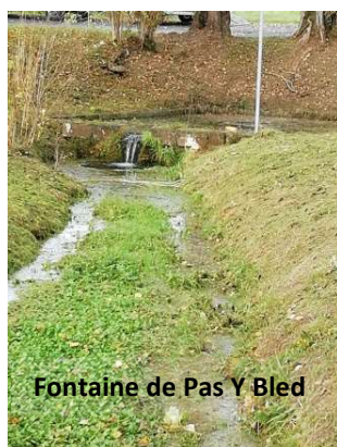
Fontaine de Pas Y Bled

Chez Bouit- Chez Brunet, La Barillauderie, Pas Y bled, L'entre deux, Le bourg à côté de la colonne à verre, Le Breuil, Bergis.