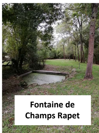
Fontaine de Champs Rapet