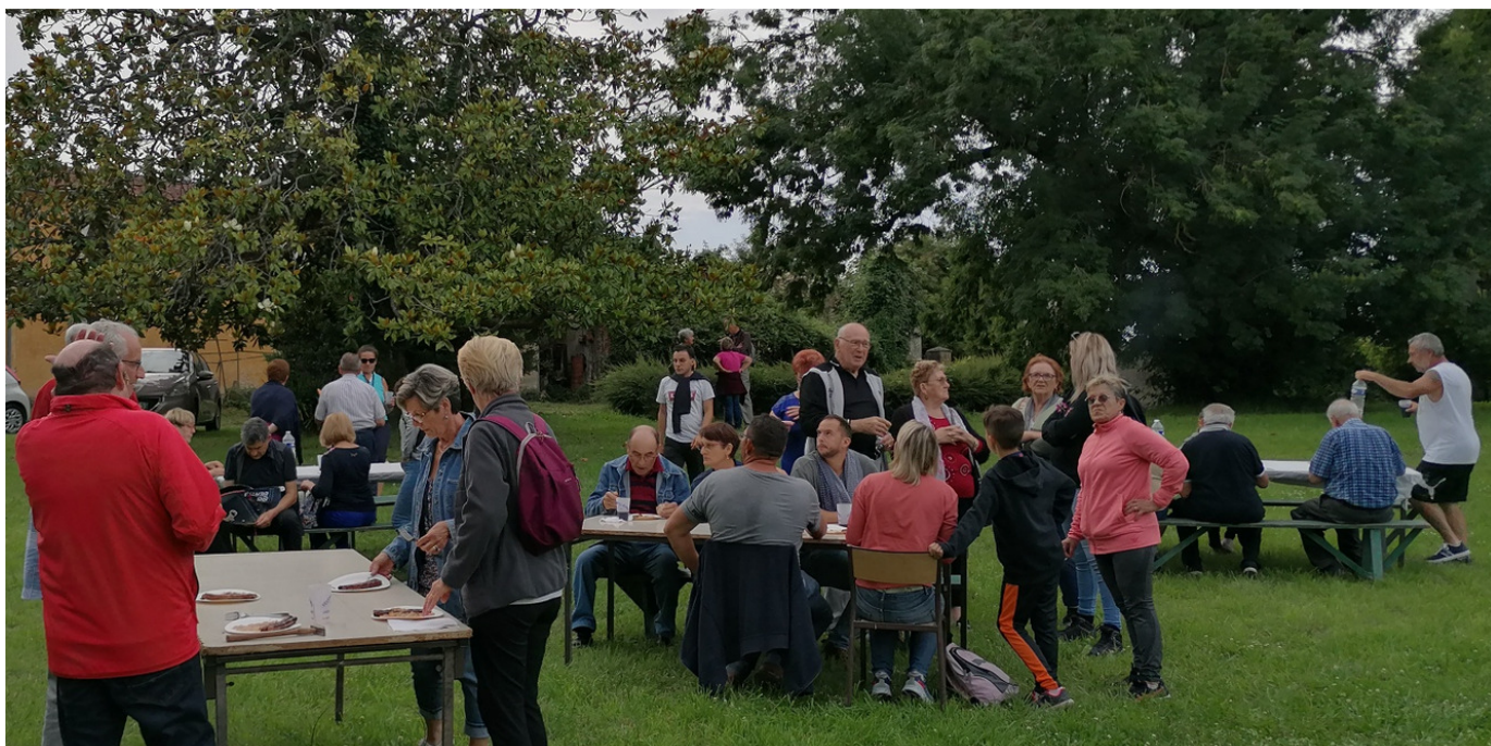
Une façon ludique de découvrir la commune