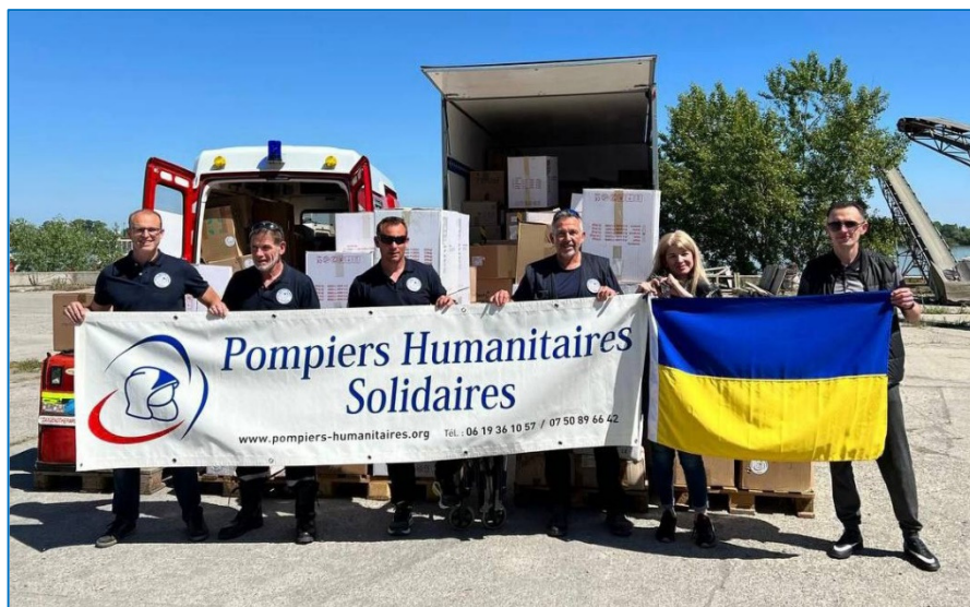
Photo prise à ODESSA