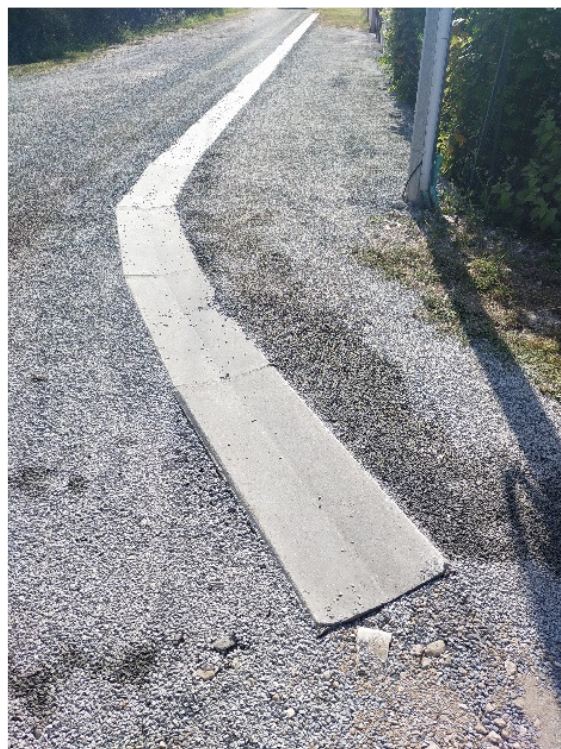
Chemin communal au lieu-dit l'Entre Deux