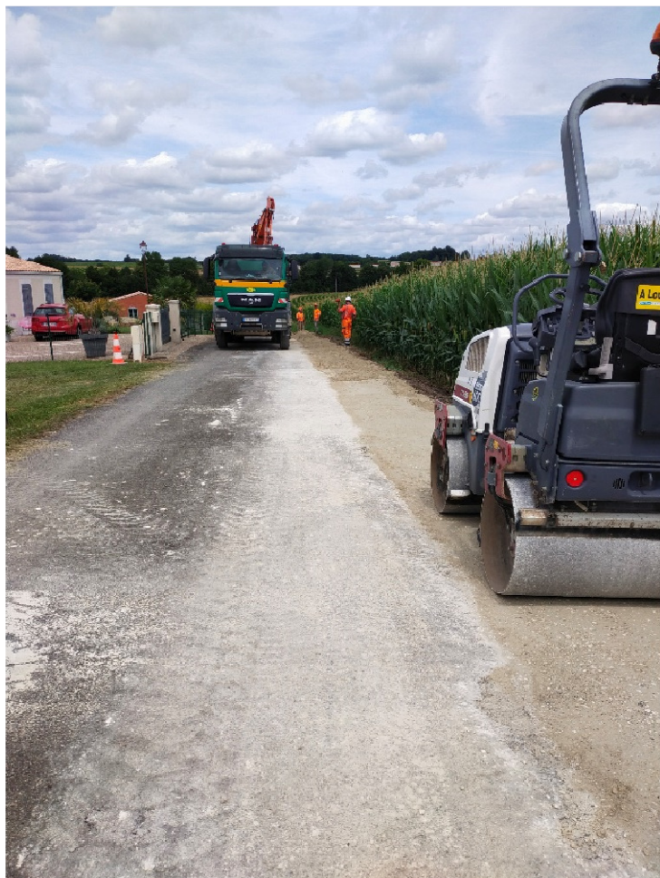
Impasse des Fargues

Une demande de subvention auprès du département a été déposée dans le cadre de la voirie accidentogène.