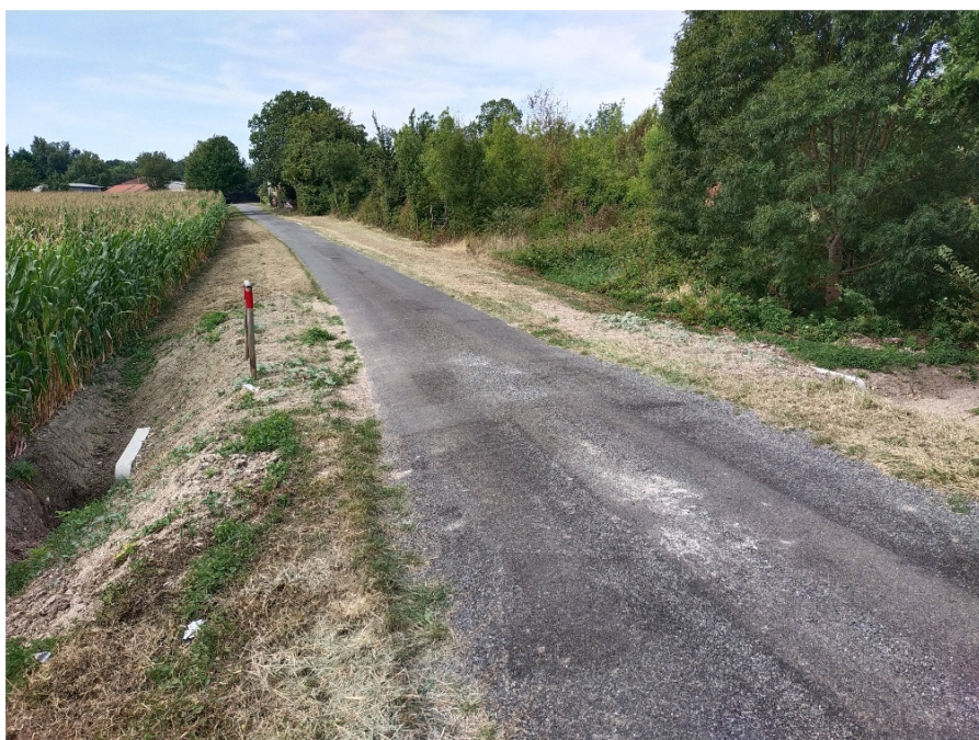
Route communale en direction du hameau de la Barrillauderie