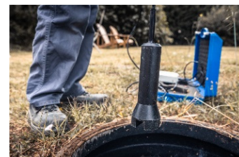
Mesure de boue d'une fosse

Ils conseillent les particuliers sur l'entretien de leurs systèmes d'assainissement et les aident à maintenir, le plus longtemps possible, leurs installations d'assainissement en bon état de fonctionnement. La réalisation d'une mesure de la hauteur de boues dans la fosse permet d'informer les propriétaires sur l'opportunité de programmer une vidange.